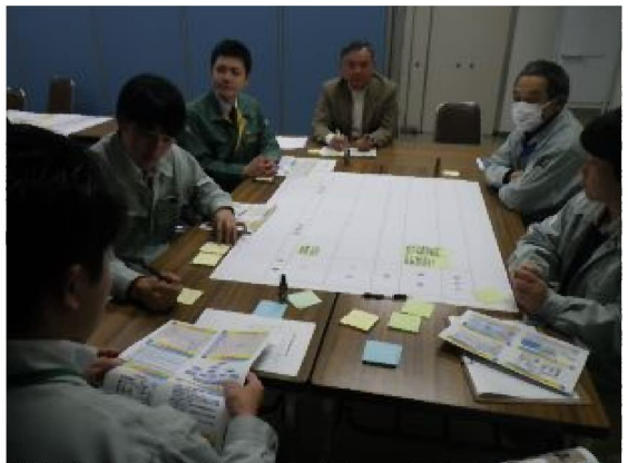
I P M 訓練 （対応討議、施策決定）