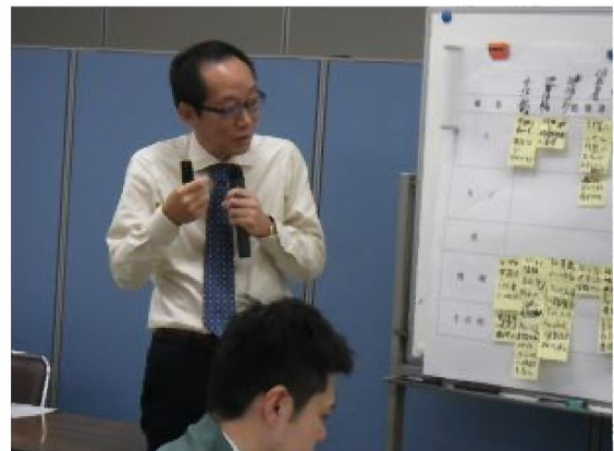
I P M 訓練 （講評）