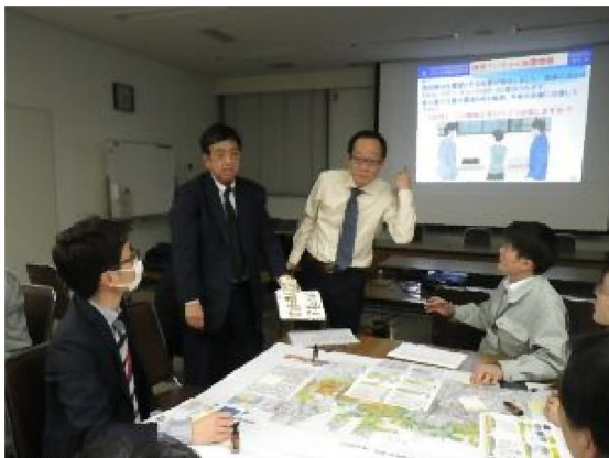
I P M 訓練 （状況付与、設問出題）