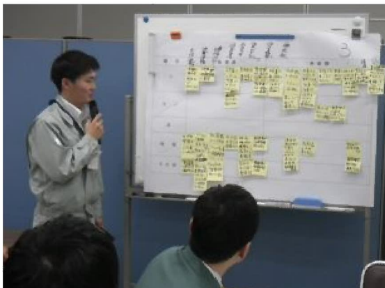
I P M 訓練 （討議・訓練結果発表）